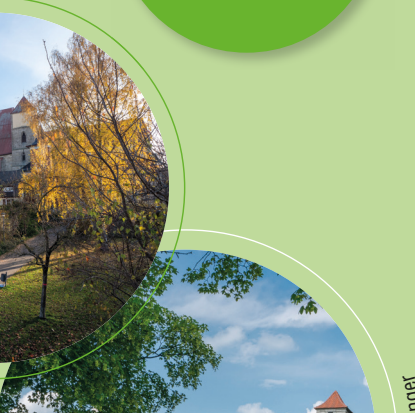
Hohenzollernfestung Wülzburg